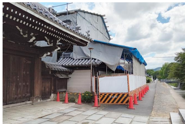
修復続く築地塀と太鼓楼(奥)