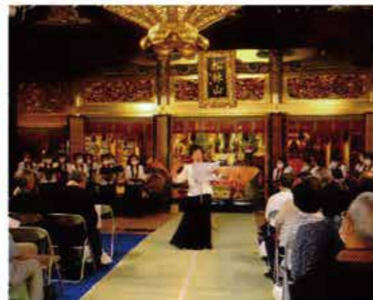
▲ 滋賀教区寺族婦人会「響流」

午前は、別院仏教婦人会 滋賀教区寺族婦人会「響流」 午後は、別院仏教婦人会 東海教区「コスモス」 各々披露されました。