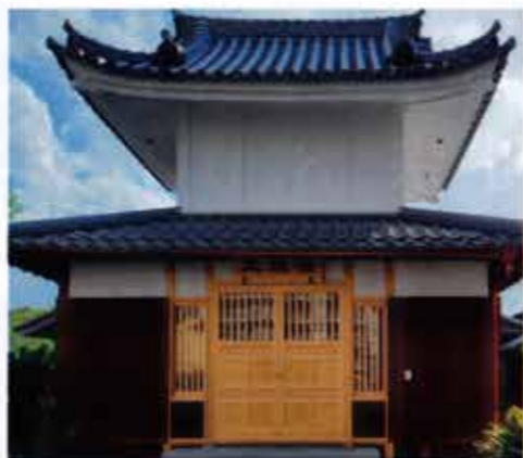
▲ 修復された太鼓楼

◎「みんな花になれ」の歌唱について 午前は、別院仏教婦人会・滋賀教区寺族婦人会「響流」が 午後は、別院仏教婦人会・東海教区「コスモス」が 各々、披露